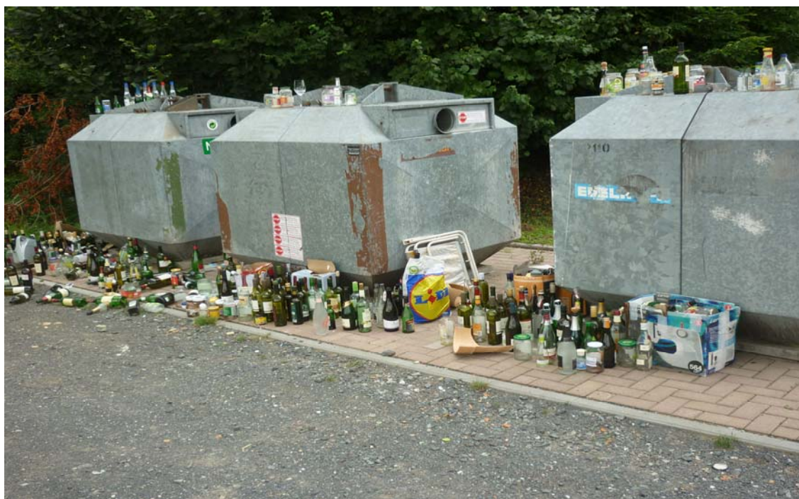
Foto vom 19.07.2011: Altglascontainer am Standort TV-Heim (gegenüber REWE-Markt)